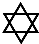
Estrella de David

Los planetas son los elementos zodiacales escogidos por los alquimistas del medievo en la descripción de la Obra Alquímic, y para referirse a ellos utilizan numerosas analogías; como ejemplo de las más significativas, es la complementariedad del Rey y la Reina, que es una de las formas para citar al binomio del Sol y la Luna. Estos dos planetas (en astrología a la luna se le da la categoría de planeta), son los encargados de nuclear las dos fuerzas de la Creación, y como planeta mediador se tendríamos a Saturno, con doble vertiente, una limitadora (saturno en capricornio) al actuar sobre el modelo lunar, y la otra función a realizar sería la del equilibrio (saturno regente de acuario, exaltado en libra), en este caso opera sobre la naturaleza solar. Tanto del Sol como de la Luna dependerían el resto de los otros cuatro planetas visibles: Júpiter-Marte colgarían de la influencia lunar y Mercurio-Venus de la solar. El cuadro quedaría de la siguiente manera: